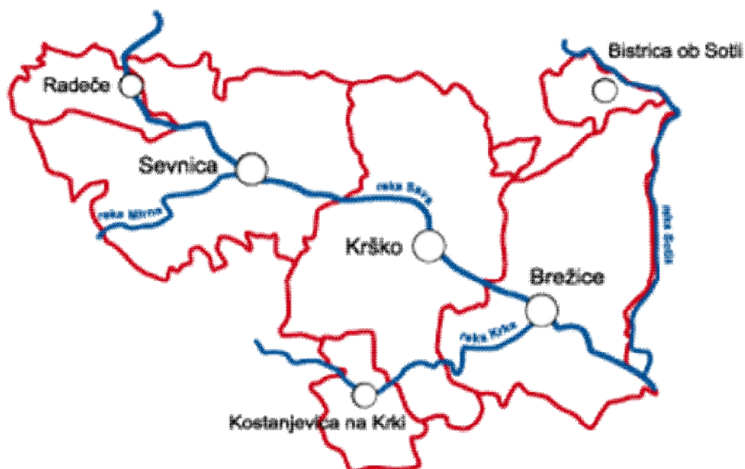
Slika 1: Območje priprave RRP Spodnjeposavske razvojne regije