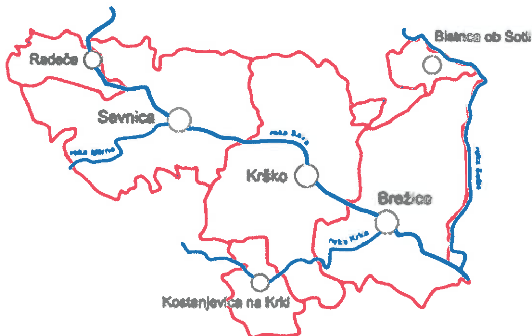
Slika 1: Območje priprave RRP Razvojne regije Posavje